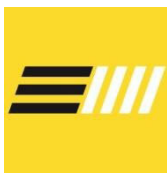
CD CorreAyo Spar Tenerife