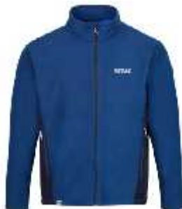
Cod: 91Q MARINO